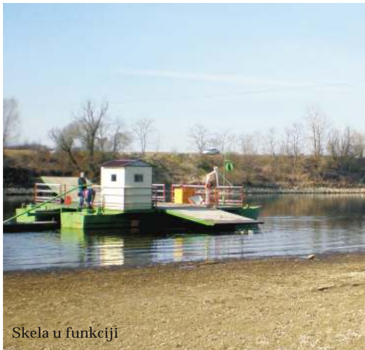
Skela u funkciji