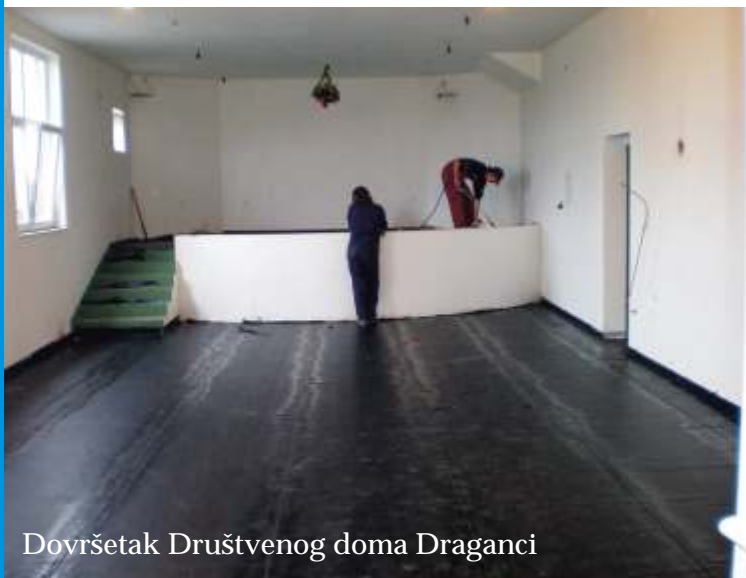
Dovršetak Društvenog doma Draganci

projekta je 10,5 milijuna kuna, radovi koji su pošli najviše će se izvoditi u ovoj kalendarskoj godini, a paralelno s time radit ćemo i sekundarnu mrežu vodovoda.