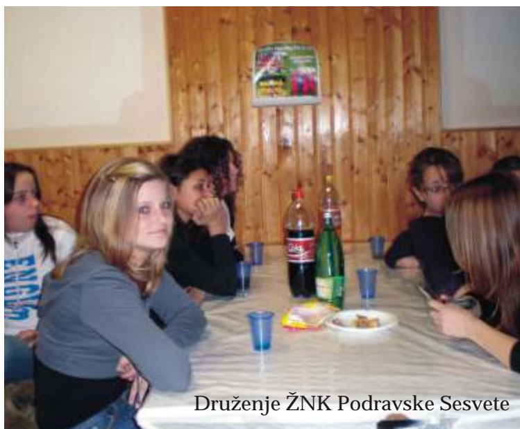
Druženje ŽNK Podravske Sesvete

Nekoliko dana kasnije odradili smo jedan trening u dvorani u Virju, a 04. ožujka smo započeli sa treninzima i pripremama na našim sportskim terenima. Nadamo se da će nam ova godina biti uspješna kao što je uostalom i uspješno započela.