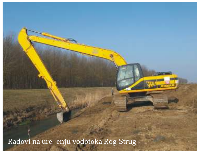
Radovi na uređenju vodotoka Rog-Strug

Kanal Rog-Strug je jedan od najznačajnijih vodotoka na ovom području jer se proteže usporedno s rijekom Dravom od Molvi do pitomskog područja gdje