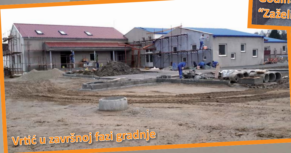
Vrtić u završnoj fazi gradnje