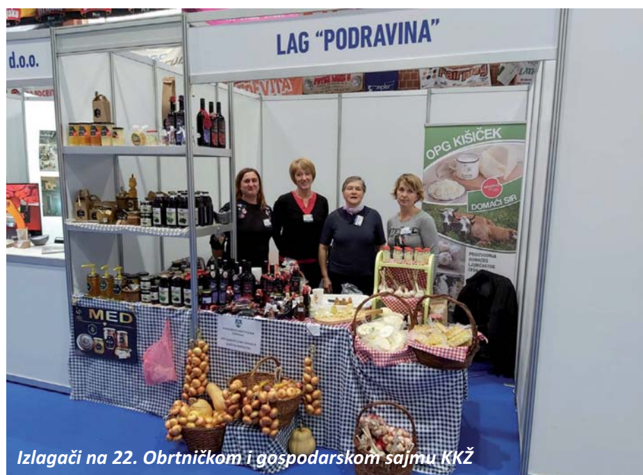
Izlagачi na 22. Obrtničkom i gospodarskom sajmu KKŽ