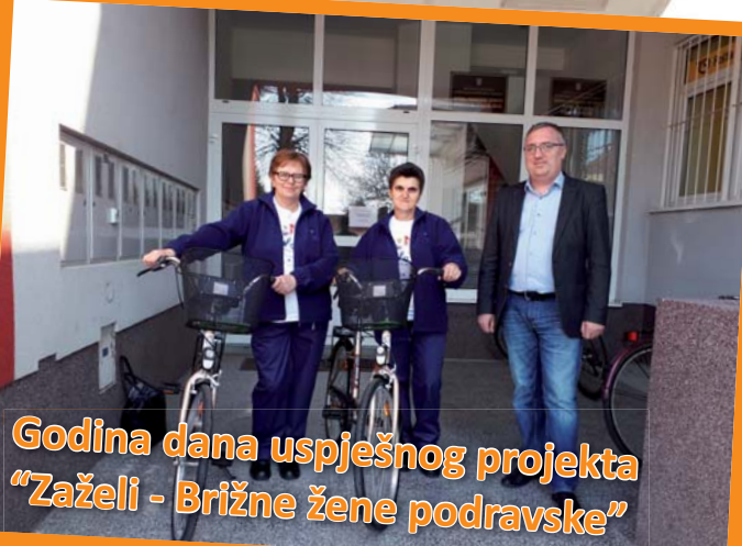
Godina dana uspješnog projekta "Zaželi - Brižne žene podravske"