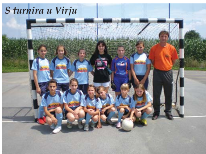
S turnira u Virju

Prvi jači turnir smo imali u Virju početkom