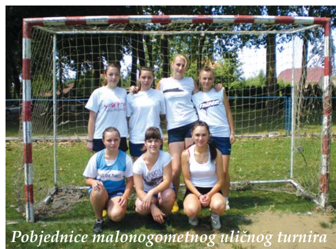
Pobjednice malonogometnog uličnog turnira