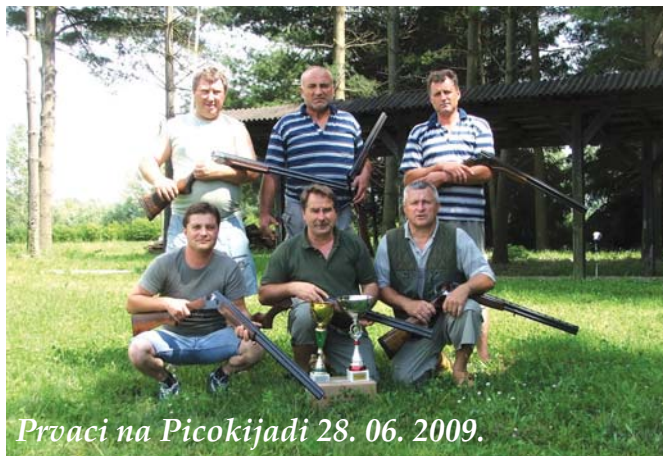
Prvaci na Picokijadi 28. 06. 2009.

Ove lovne godine, prvi puta je Đurđevac 1 dobio pravo odstrela jelena lopatara od