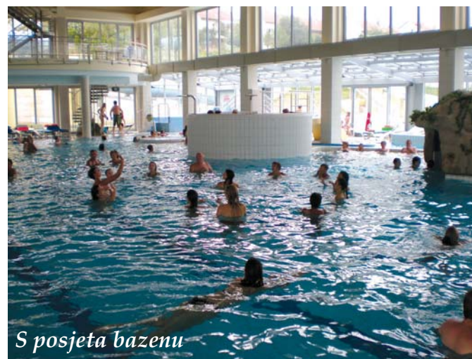
S posjeta bazenu