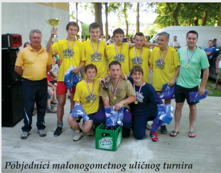
Pobjednici malonogometnog uličnog turnira

Pokrovitelj oba turnira bila je naša općina.