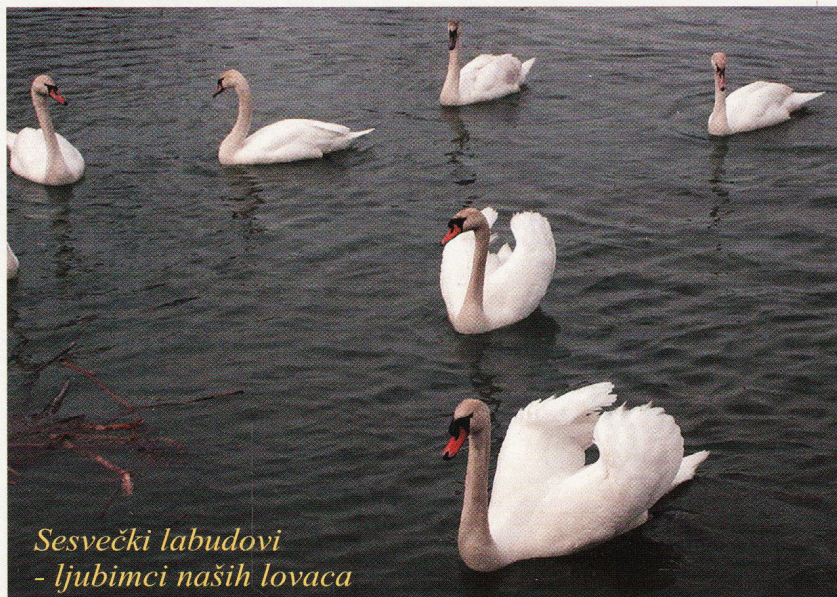
Sesvečki labudovi - ljubimci naših lovaca

Tijekom većeg dijela povijesti ljudskog roda lov je bio neizbježan pratitelj i najvažnije zanimanje većine ljudi jer im je osiguravao hranu, odjeću te je podmirivao i ostale životne potrebe. Bila je to borba za opstanak i preživljavanje, obrana od divljih zvijeri. Razvojem poljoprivrede, a naročito stočarstva značaj lova se sve više