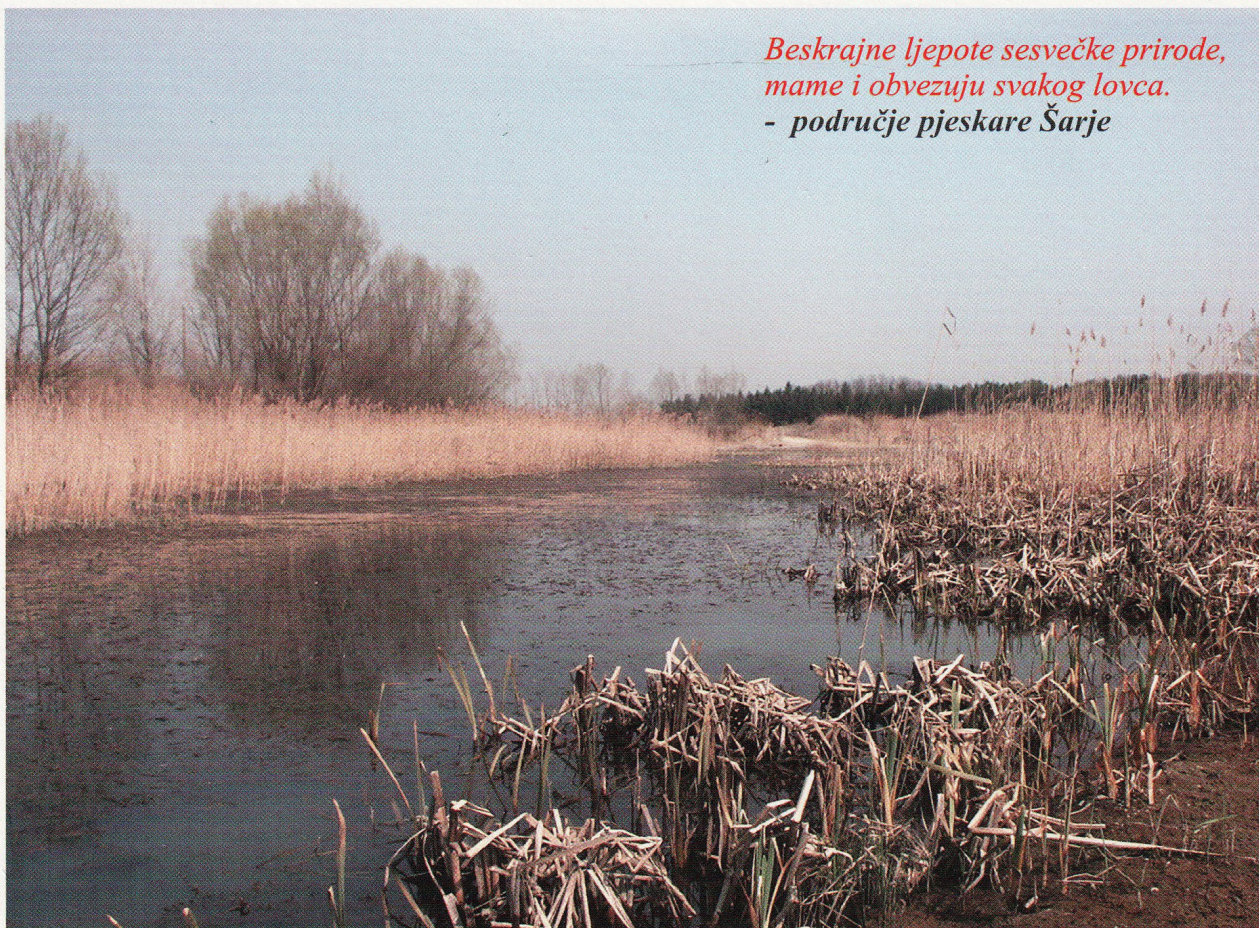
Beskrajne ljepote sesvečke prirode, mame i obvezuju svakog lovca. - područje pjeskare Šarje

smanjivao, ali i mijenjao karakter iako je zadržao visoko mjesto u ljudskom životu. Prije svega tu je potreba čovjeka za boravkom u prirodi, druženjem, kao i željom da tu prirodu očuva od svih neželjenih utjecaja, da vodi brigu o uzgoju i zaštiti divljači, osobito ugroženih vrsta, a da višak divljači odstrijeli kao zasluženu nagradu za svoj rad. Odstrel divljači i stjecanje trofeja današnji je civilizacijski odraz prastarog odnosa čovjeka i prirode. Lov je u neku ruku i vrsta zabave, natjecanje u rukovanju